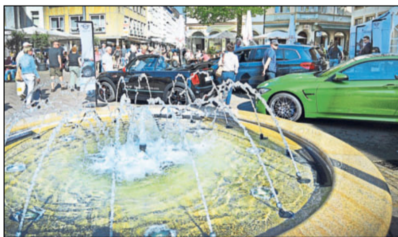
Auch auf dem Alten Markt können Stadtbummeler schnittige Autos bewundern. Manche sogar »oben ohne«.

Die Ausstellung wird an diesem Sonntag um 11.30 Uhr im Museum im Ravensberger Park eröffnet und ist dort bis zum 28. August zu sehen.