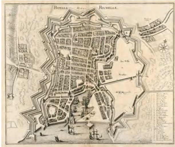
Estampe de Mathias Merian 1638

La Société internationale de Castellologie invite à l' exposition :