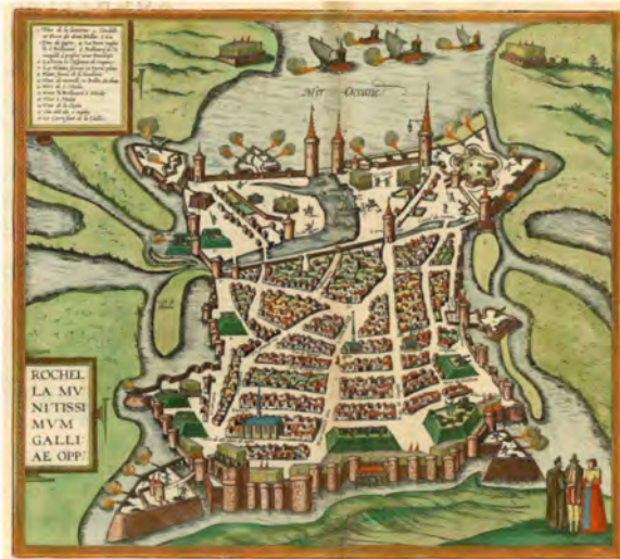
Estampe de Frans Hogenberg 1597