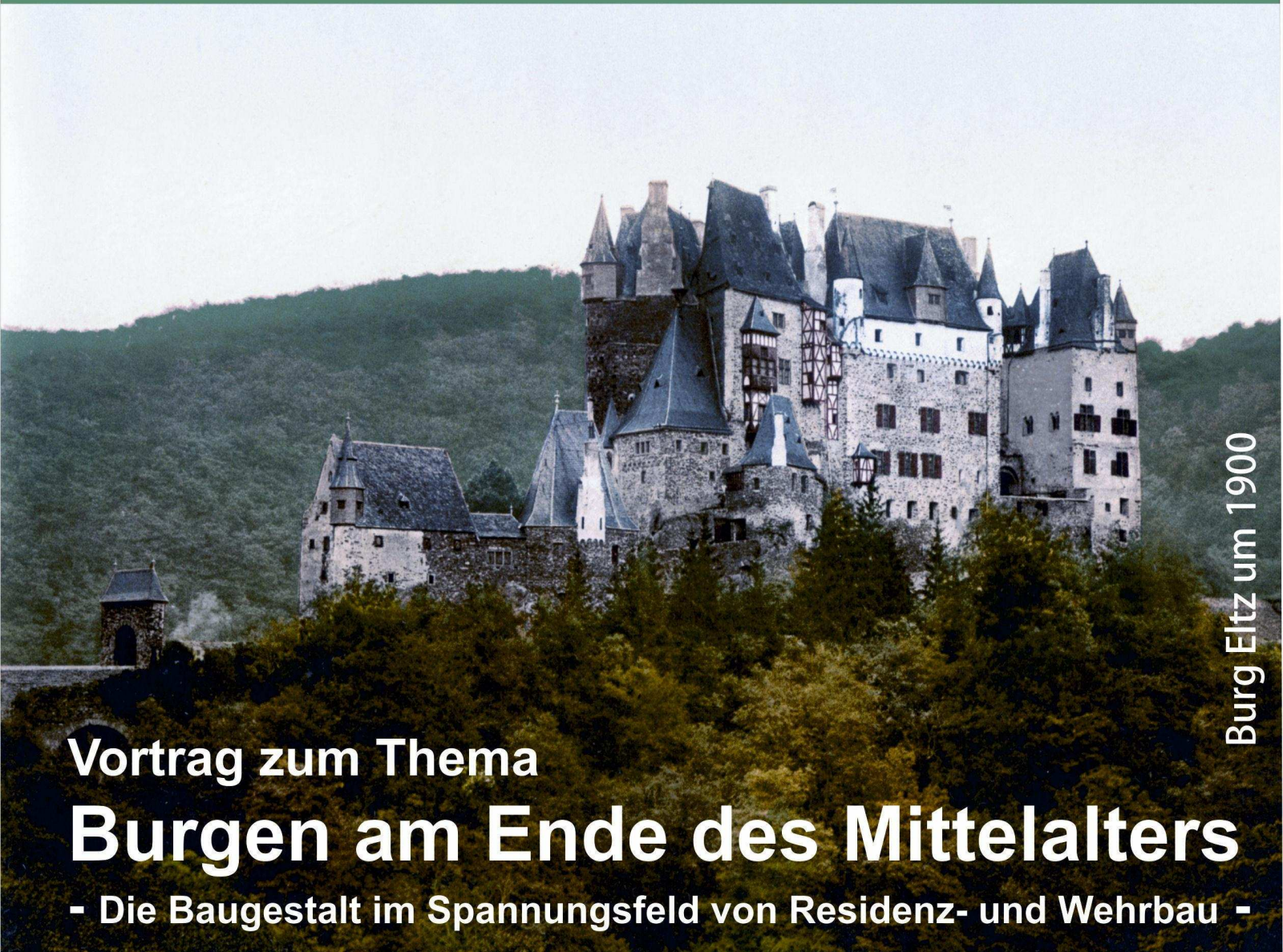
Burg Eltz um 1900